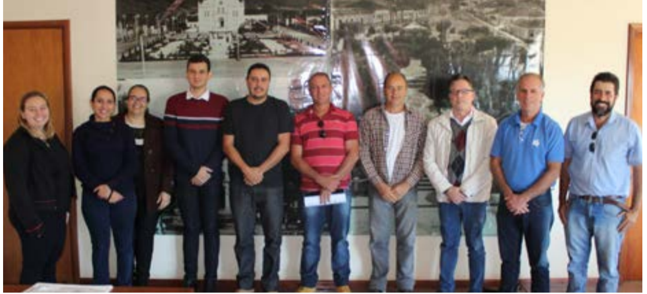
Reunião no gabinete tratou sobre concessão de terreno para a AACAR

A comercialização dos produtos terá rotulagem devidamente registrada por órgãos competentes e segundo a legislação vigente.