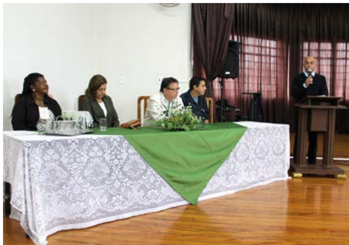
A mesa principal da conferência com presença de autoridades

Na plenária final através da participação democrática de todos os delegados presentes, além dos convidados, lideranças comunitárias e usuários foram aprovadas as propostas que serão encaminhadas ao executivo municipal, estadual e Federal. Propostas estas que vieram dos seguintes eixos: Eixo 1 Os desafios para consolidação do suas frente aos impactos da crise financeira da União do estado e dos Municípios a emenda constitucional nº 95 a proposta da reforma previdenciária e a reforma trabalhista; Eixo 2, A rede de proteção social do SUAS e a relação com os órgãos de garantia do direito; eixo 3, Democracia participativa, controle social e protagonismo do usuário do Suas, nada sobre nós sem nós. Na sequência foram eleitos os delegados que irão representar o Conselho Municipal de Assistência Social e a Secretaria Municipal de Desenvolvimento Social e Habitação na conferência Regional que será realizada na cidade de Divinópolis, no mês de outubro.