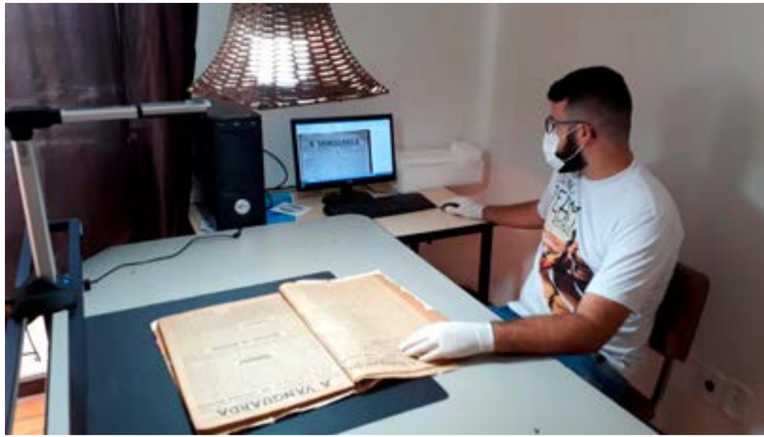
O trabalho inclui a conservação do acervo em papel depois da digitalização

A Prefeitura gastou R$ 7 mil com o equipamento que foi proveniente do Leilão Público 001/2018. O scanner também servirá depois da digitalização para ser utilizado em conservação de documentos públicos