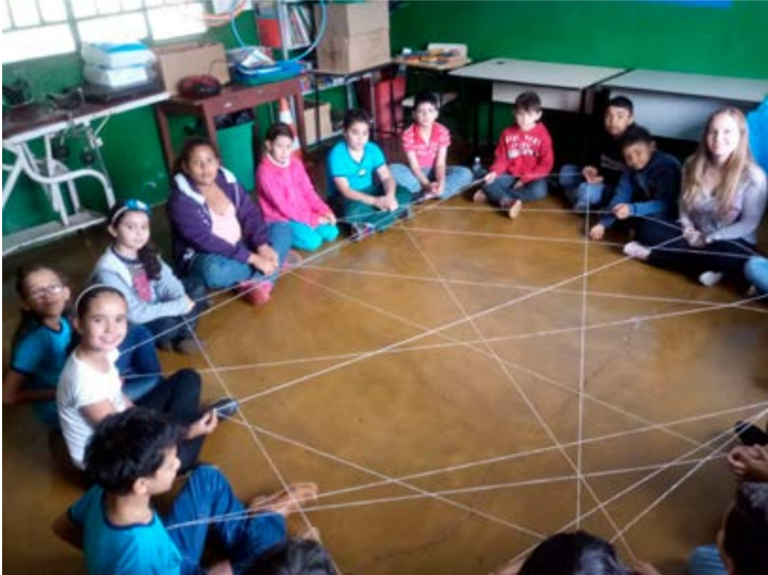
Psicóloga fazendo atividades com alunos da E. M. Jerônimo Taveira

Recentemente foi aprovada pelo Congresso Nacional a Lei Nº 13.185, que obriga instituições, como a escola, a combater o bullying . Esse termo americano tem se popularizado no Brasil, e refere-se a agressões, sejam elas físicas ou verbais, que ocorrem de maneira frequente e com intencionalidade, onde o violentado sofre dores e angústias recorrentes de ações maliciosas.